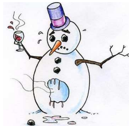
Waarom een sneeuwman geen glühwein drinken kan

Sinterklaas is net in Nederland, maar de Ouderraad is al weer volop bezig met de voorbereidingen van de jaarlijkse Kerstmarkt op 22 december. Na het succes van vorige jaren heeft iedereen het natuurlijk al lang in de agenda gezet en oppas voor de allerkleinsten of de hond geregeld! Terwijl de kinderen die avond binnen genieten van allerlei lekkere zelfgemaakte hapjes, kunnen ouders zich buiten op het schoolplein vermaken. Heerlijke warme winterhappen, gezellige drankjes en een heleboel leuke andere ouders om de feestdagen mee in te luiden. Uiteraard swingt de 'Curtevenneschoolband' als nooit tevoren. We zetten alles op alles om er een groots feest van te maken. Daar moet je dus bij zijn!